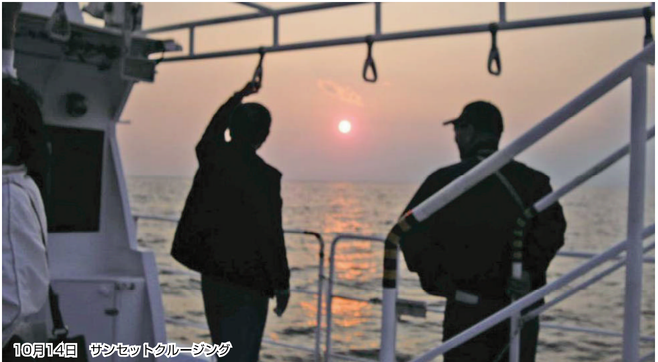
10月14日 サンセットクルージング

No. 20 発行者 沼津市商工会 会長 松永公良 〈本所・原支所〉沼津市原1200番地の1 TEL (055) 966-1331 FAX (055) 967-4925 〈戸田支所〉沼津市戸田1028番地の5 TEL (0558) 94-2224 FAX (0558) 94-4029 編集 沼津市商工会広報委員会